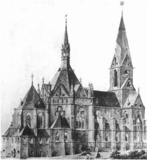
St. Laurentius, Essen-Steele